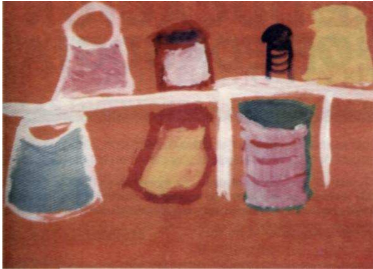
Paulina Zapata, Mesa con hilos , vinilo, 2005.